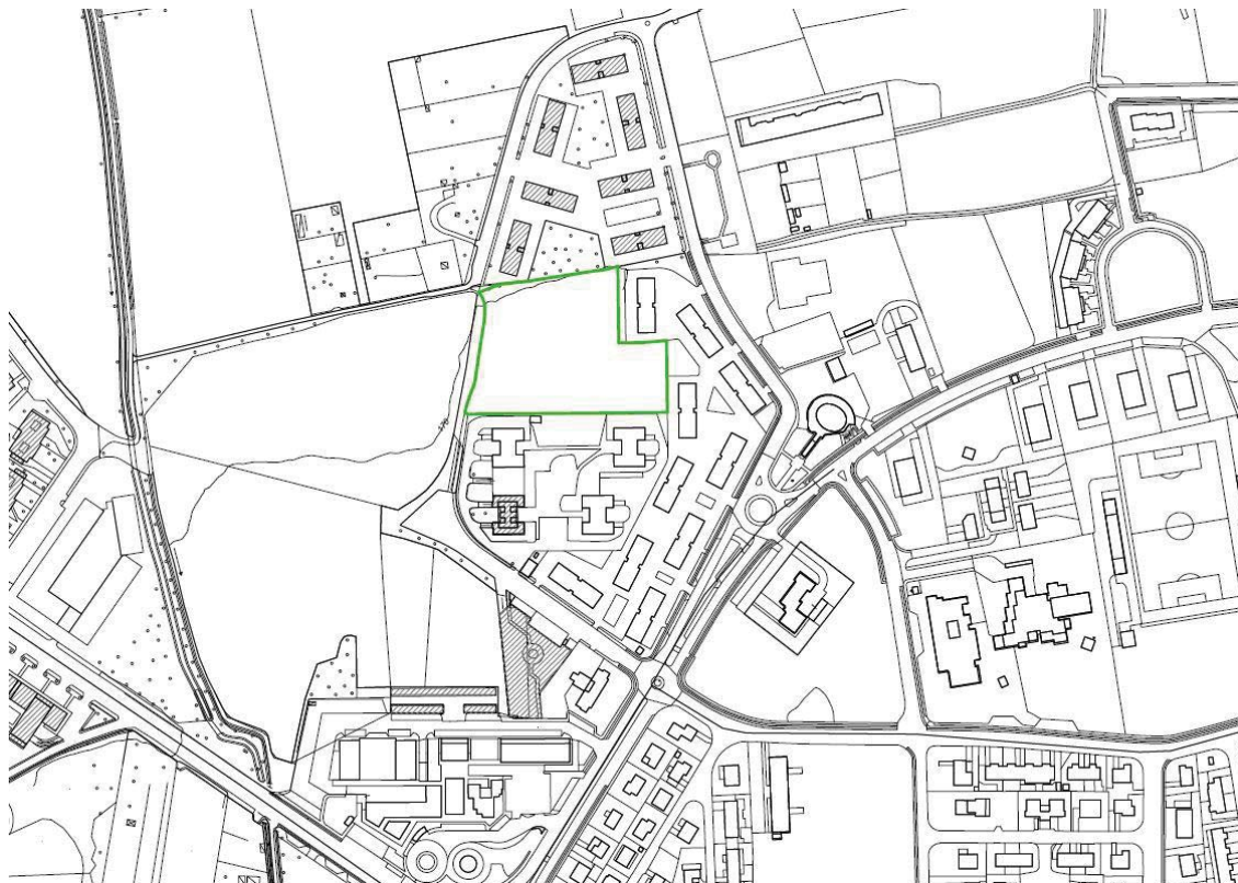
Planimetria Comune di Verdellino (fuori scala)

Allegato 3 Planimetrie con individuazione delle aree in Comune di Verdellino e in Comune di Ciserano per l'intervento di cui al precedente art.5.