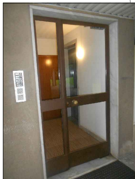
Portoncino ingresso vano scale