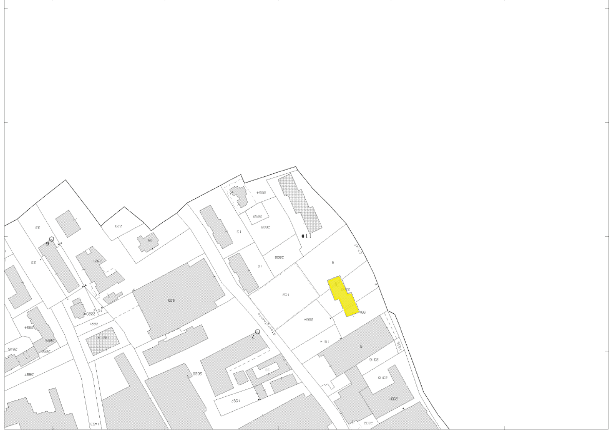
ESTRATTO MAPPA CATASTALE