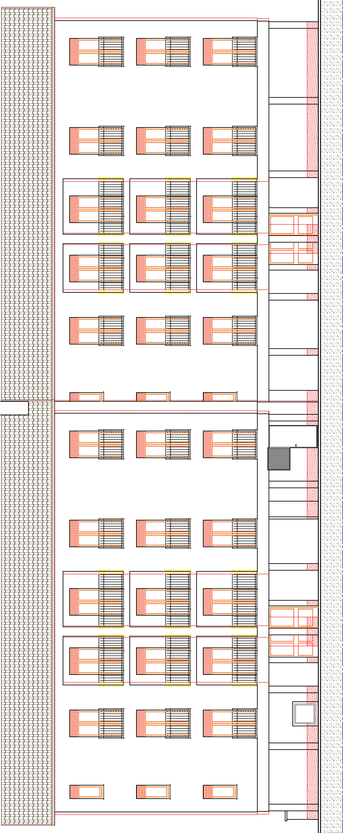
PROSPETTO EST IN SOVRAPPOSIZIONE