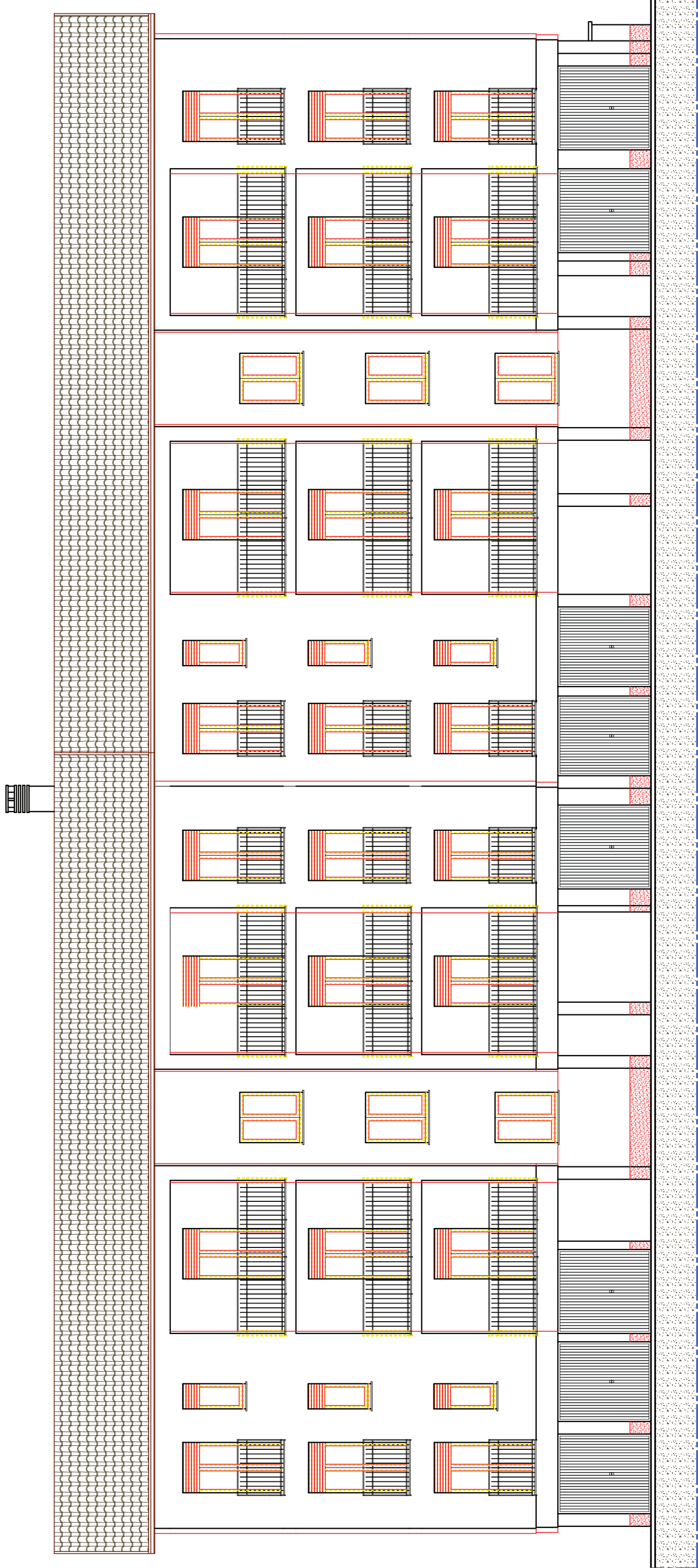
PROSPETTO OVEST IN SOVRAPPOSIZIONE