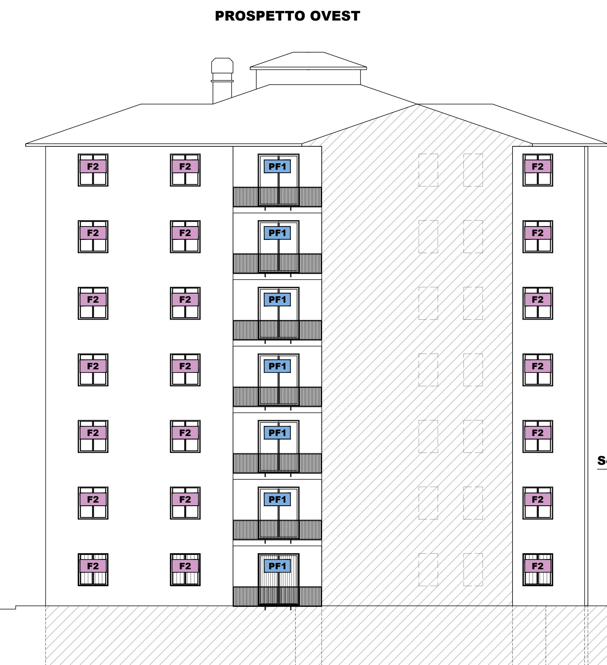
DETTAGLIO DI FACCIATA (scala 1:50)